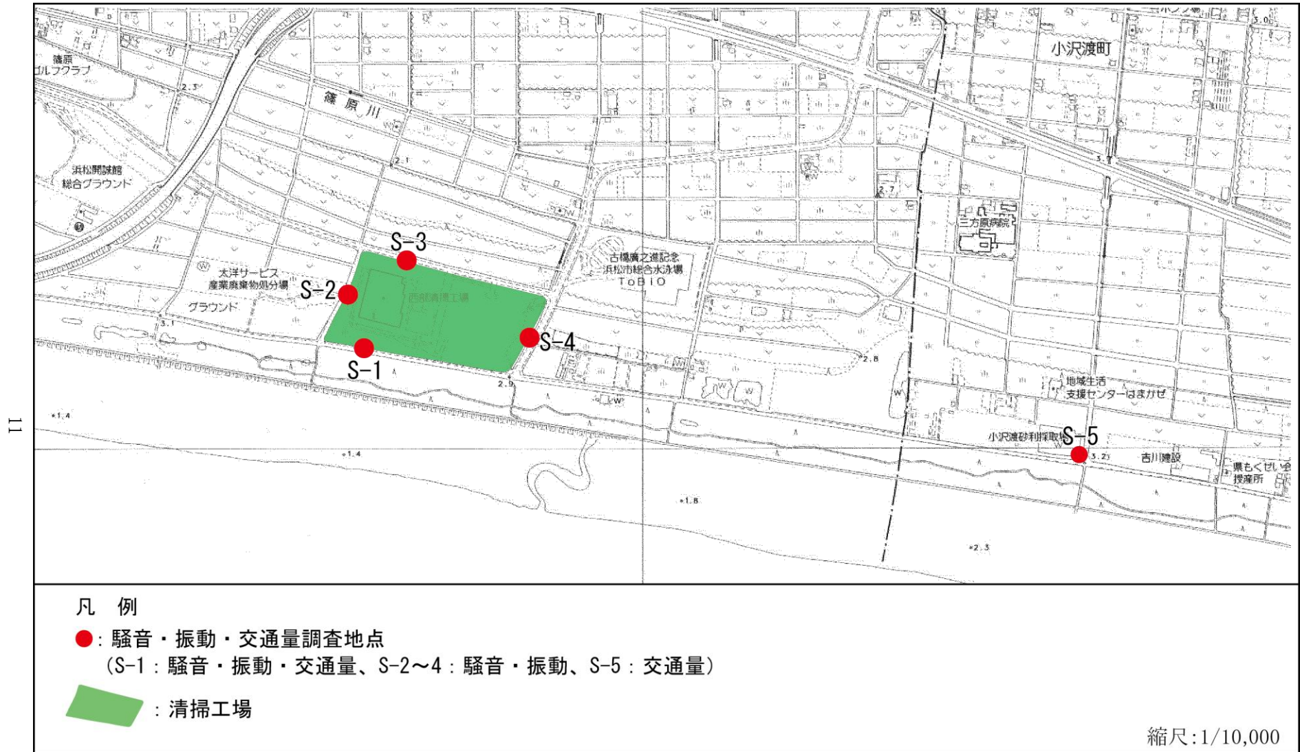
図3.3 騒音・振動・交通量調査地点図