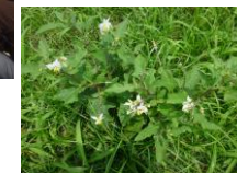
外来種「ワルナスビ」 撮影：清掃工場敷地内