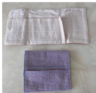
手ぬぐいからマスク