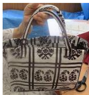
帯からエコバッグ