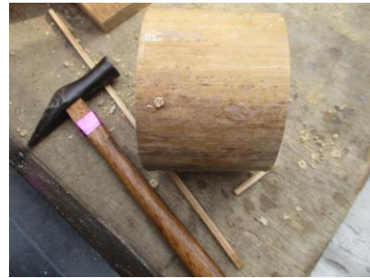
3月体験講座 「竹の苗ポットづくり」