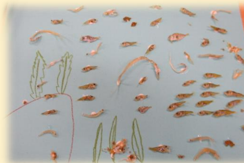
ミニ水族館の完成品